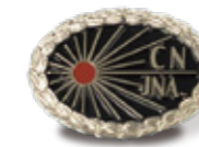
感染管理認定看護師