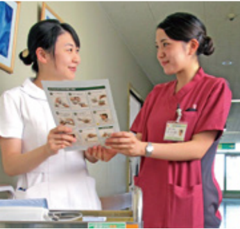
循環器呼吸器病 センター