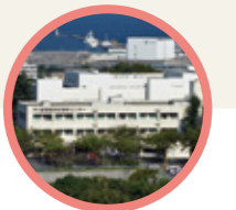
循環器呼吸器病センター