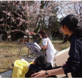
精神医療センター