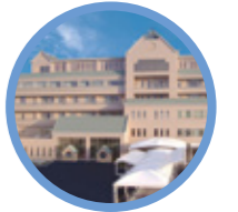
こども医療センター