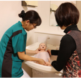
こども医療センター