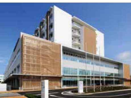
がんセンター 本館