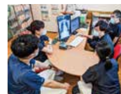
多職種カンファレンス