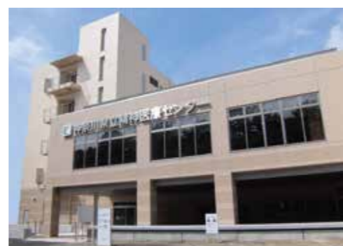
精神医療センター 本館

〒233-0006 神奈川県横浜市港南区芹が谷 2-5-1 TEL.045-822-0241