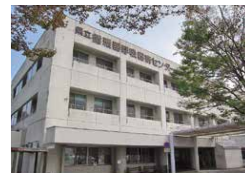
循環器呼吸器病センター 中央棟

〒236-0051 神奈川県横浜市金沢区富岡東 6-16-1 TEL.045-701-9581