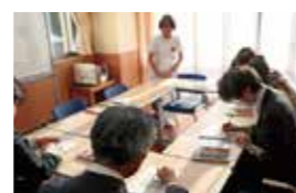
デイケアプログラム