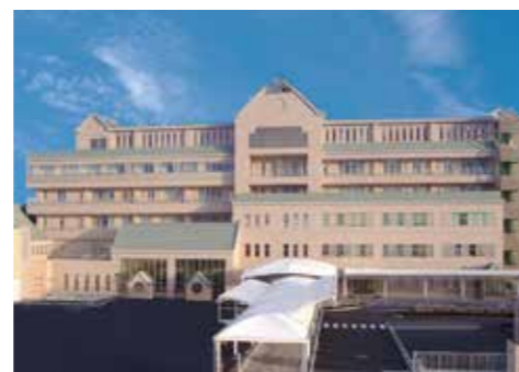
こども医療センター 本館

〒232-8555 神奈川県横浜市南区六ツ川 2-138-4 TEL.045-711-2351