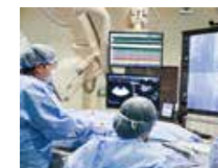
心臓カテーテル検査